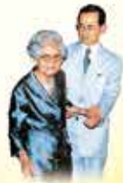
พระมหากษัตริย์องค์ปัจจุบัน