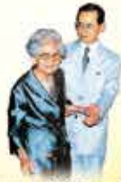
พระมหากษัตริย์องค์ปัจจุบัน