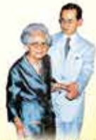
พระมหาพจนานันท์มหาดิลกคุณุ