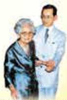
พระมหาพรตธรรมาภัย