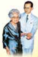
พระมหาพนครธมออกทัศนูป