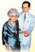
พระมหากษัตริย์องค์ที่๑๐