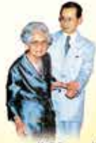
พระมหากษัตริย์องค์ปัจจุบัน