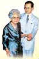
พระมหากษัตริย์องค์ปัจจุบัน