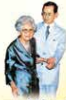
พระมหามันตรีอรรถกิตติกุล