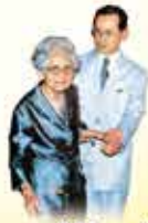
พระมหากษัตริย์องค์ที่๖๖