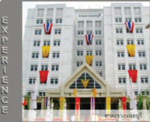
อาคารพาณิชย์ 4 ชั้น