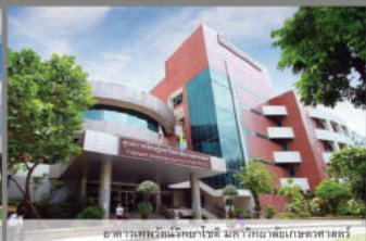
อาคารพาณิชย์ 4 ชั้น อาคารพาณิชย์ 4 ชั้น