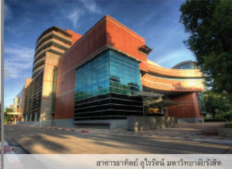
อาคารพาณิชย์ 4 ชั้น อาคารพาณิชย์ 4 ชั้น

222 ถนนพหลโยธิน/สุขุมวิท 101 แขวงคลองเตย เขตคลองเตย กรุงเทพมหานคร 10900 โทร : 02-5917745, 02-5806574 โทรสาร : 02-9543759 อีเมล : cando001@hotmail.com