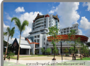
อาคารสำนักงาน 4 ชั้น อาคารพาณิชย์ 4 ชั้น

บริษัท แคนดู คอนสตรัคชั่น จำกัด CAN DO CONSTRUCTION CO.,LTD.