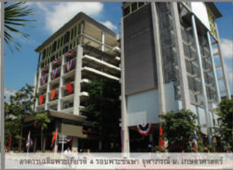
อาคารพาณิชย์ 4 ชั้น อาคารพาณิชย์ 4 ชั้น