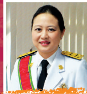
ดร.รวีวรรณ กุริตช E 43 เลขาธิการสำนักงานนโยบายและ แผนทรัพยากรธรรมชาติและสิ่งแวดล้อม